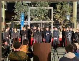
体験後はフェスで披露も！