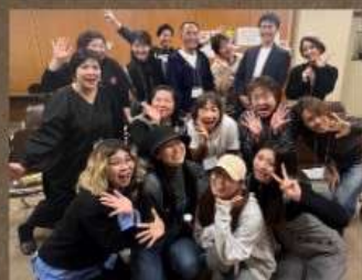
ワイワイ楽しいゴスペル体験